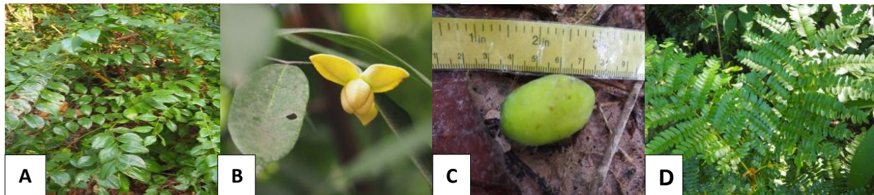
Figure 2 The importance value index (IVI) of medicinal plants in Khok Khu Khat - Ban Khu Si Chae community forest (A) Erythrophleum succirubrum Gagnep. (B) Melodorum fruticosum Lour. (C) Canarium subulatum Guill. (D) Peltophorum dasyrachis (Miq.) Kurz.

สำคัญเท่ากับ 0.27 ตามลำดับ และฤดูฝน พรรณไม้เด่นที่มีค่าดัชนีความสำคัญมากที่สุดคือ พันชาติ Erythrophleum succirubrum Gagnep.) รองลงมาคือ ลำตวน ( Melodorum fruticosum Lour.) มะกอกเกลื้อน ( Canarium subulatum Guill.) และอะราง ( Peltophorum dasyrachis (Miq.) Kurz.) ตามลำดับ เช่นเดียวกับกับฤดูแล้ง โดยมีค่าดัชนีความสำคัญเท่ากับ 25.08, 24.78, 21.59 และ 14.86 ตามลำดับ ส่วนพรรณไม้ที่ค่าดัชนีความสำคัญน้อยที่สุดคือข่าป่า ( Alpinia malaccensis (Burm. f.) Roscoe.) บุกคางคก ( Amorphophallus paeoniifolius (Dennst.) Nicolson) มะม่วงป่า ( Mangifera coloneura Kurz.) มะลิป่า ( Jasminum nervosum Lour.) ซึ่งมีค่าดัชนีความสำคัญเท่ากับ 0.25 (Figure 2 และ Table 3)